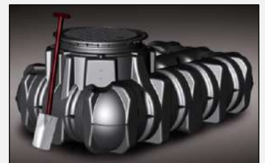
Depósito Platin con cubierta paso vehículos