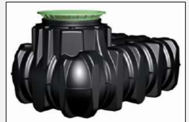
Depósito Platin con cubierta paso peatones